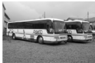
●バスは大型観光バスの予定です